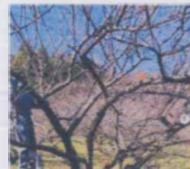
秋間梅林での農家体験を続けた方々が今度は知り合いのところで剪定体験をしたり、梅の収穫体験に再度訪れてくださったり...リーダーが多いところや、自分なりに梅を使った新たな楽しみ方を見つけて楽しんでくださる方が増えます！ 地域おこし協力隊 雨歌さん